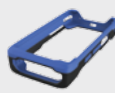
• 94ACC0132 Carcasa de goma