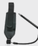
• 94ACC0133 Correa de mano (incluida)