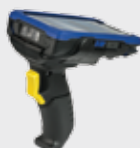
• 94ACC0170 Empuñadura