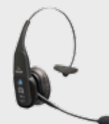
• 94ACC0127 Cascos Bluetooth VXi B350-XT